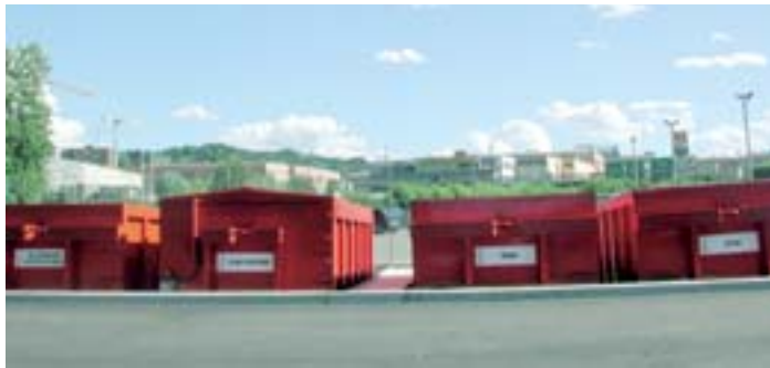
Le benne sono collocate in modo da facilitare lo scarico del materiale

Il centro è dotato di diverse benne, di cui una, con la pressa, per la carta e il cartone, situate alla sinistra di un vasto spazio esterno; al coperto, invece, sulla destra, un deposito per gli "articoli" minuti e per il mercatino del riuso. Come detto, per il momento il centro sarà aperto solo il mercoledì pomeriggio dalle 13.30 alle 16 per gli ingombranti; per il resto occorrerà avere pazienza un paio di mesi.