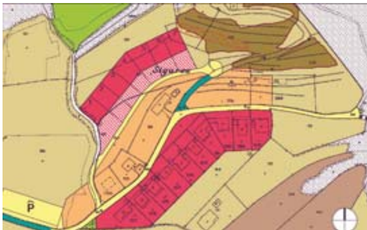
La zona edificabile di interesse comunale, qui sopra, in primo piano con il colore rosso, è stata realizzata con successo negli Anni Novanta. Sono state costruite una dozzina di abitazioni. Ora il Comune vuole ripetere l'esperienza, a monte di questa, espropriando altri fondi e ricavandone sette lotti. Nella parte superiore del terrazzamento, in verde chiaro, è indicata la zona destinata ad accogliere i pannelli solari.

• (red.) Quello di Meride non è il solito Piano regolatore perché il paesino della Montagna non è il solito paese. Ha conservato, nei secoli, una tipologia unitaria che le foto aeree utilizzate per allestire la cartografia del PR ancor meglio permettono di apprezzare.