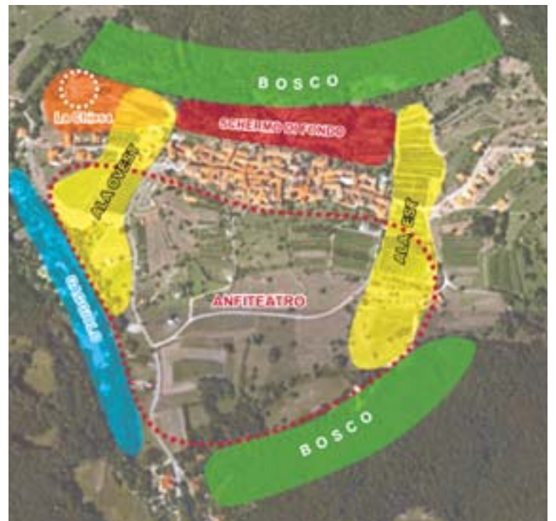
Ecco un'interessante immagine di Meride elaborata nell'ambito degli studi di Piano regolatore