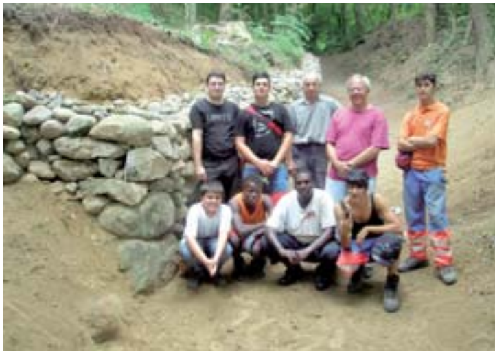
Partecipanti e docente davanti al muro appena rifatto

Il corso si è svolto nei boschi del Penz, in località Seseglio, sul sentiero che porta a Pedrate, poco sotto la zona denominata "Ronco Grande". Il Cantiere-Scuola si trova nell'itinerario numero 2 "Le tecniche viticole", della serie "Itinerari fra i vigneti", pubblicati nel 2006 nell'ambito del Centenario del Merlot. I partecipanti sono stati una decina, ben suddivisi fra gli apprendisti giardinieri operanti nella squadra comunale, alcuni