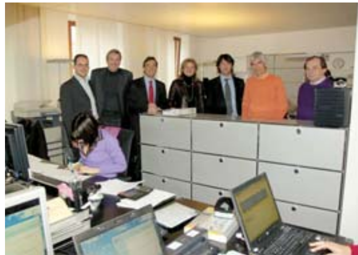
L'Esecutivo chiassese in visita alla Vion SA di via Motta 12